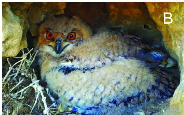
Figure 5

Oisillon de Bubo ascalaphus à différents âges (A : 10 jours, B : 22 jours) durant la période de reproduction de l'année 2020. Bubo ascalaphus chick at different ages (A: 10 days; B: 22 days) during the period of breeding during the year 2020.